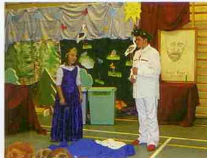
Występ Kola Teatralnego – fragment „Balladyny”.