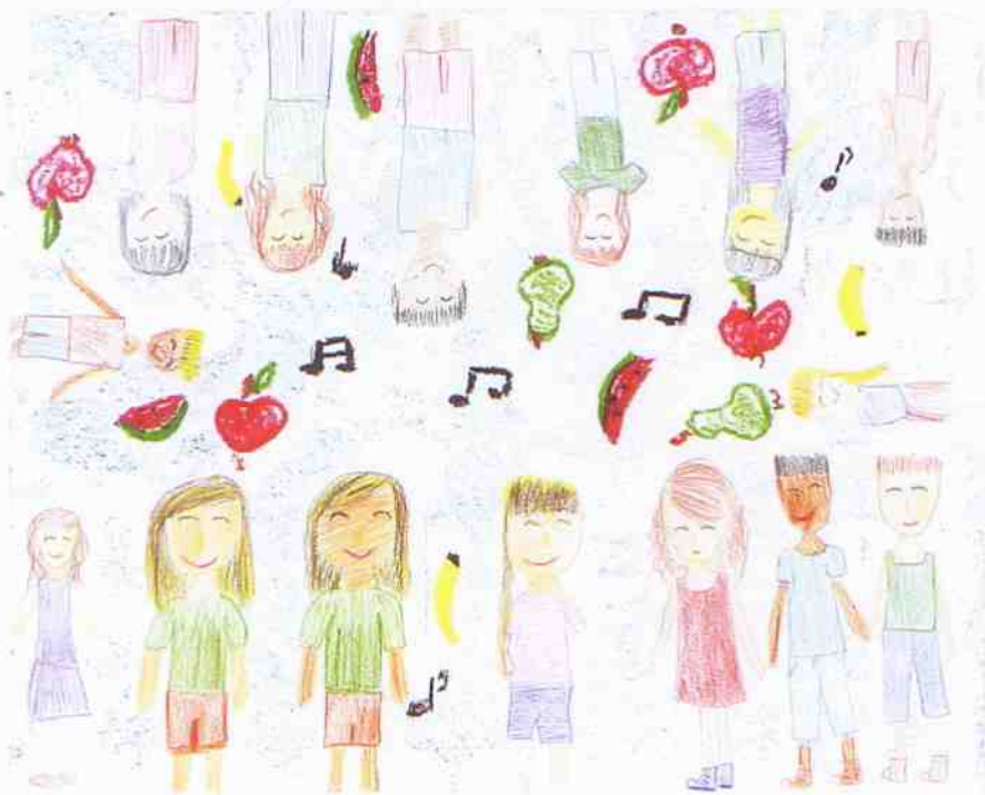
„Dzieci” Zosia Kalwa