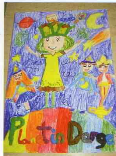
„Dobra wróżka”, praca wykonana na zajęciach języka angielskiego.