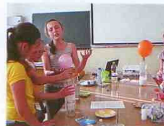
Eksperymenty, na zajęciach projektu ZS