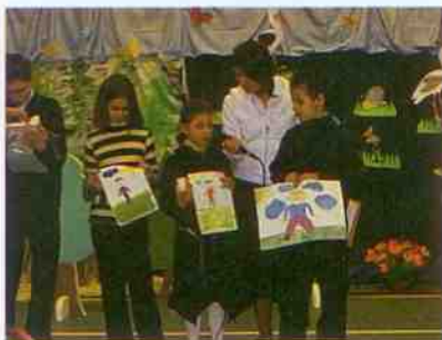
Ilustrowanie utworów Korczaka.