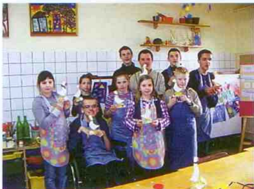
Zajęcia integracyjne w ZSS w Kadłubie

Szczęście kojarzy nam się z radością, która jest powodem uśmiechu. Czy obowiązki mogą być źródłem szczęścia? Chętniej mówimy o prawach dziecka, a obowiązki traktujemy nieco powierzchownie. Nie lubimy chodzić do szkoły, a są na świecie dzieci, dla których chodzenie do szkoły jest nierealnym marzeniem. Dorośli raczej przestrzegają naszych praw, ale to my dzieci często łamiemy prawa naszych kolegów, zapominamy, że granicą naszych praw są prawa innej osoby. Musimy wymagać od siebie odpowiedzialności za siebie i innych, wdzięczność jest równie ważna i cieszenia się życiem.