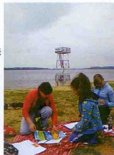
Plener malarski w Pławniowicach